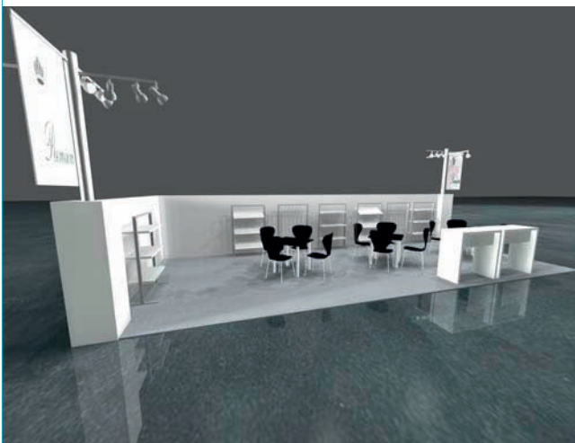
Standard Premium stand: Eckstand - Corner stand