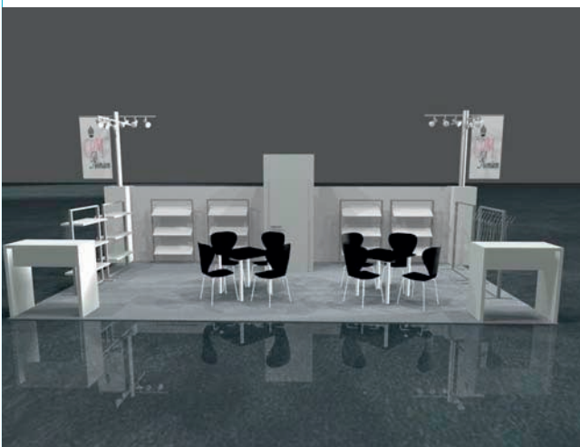
Standard Premium stand: Eckstand - Corner stand